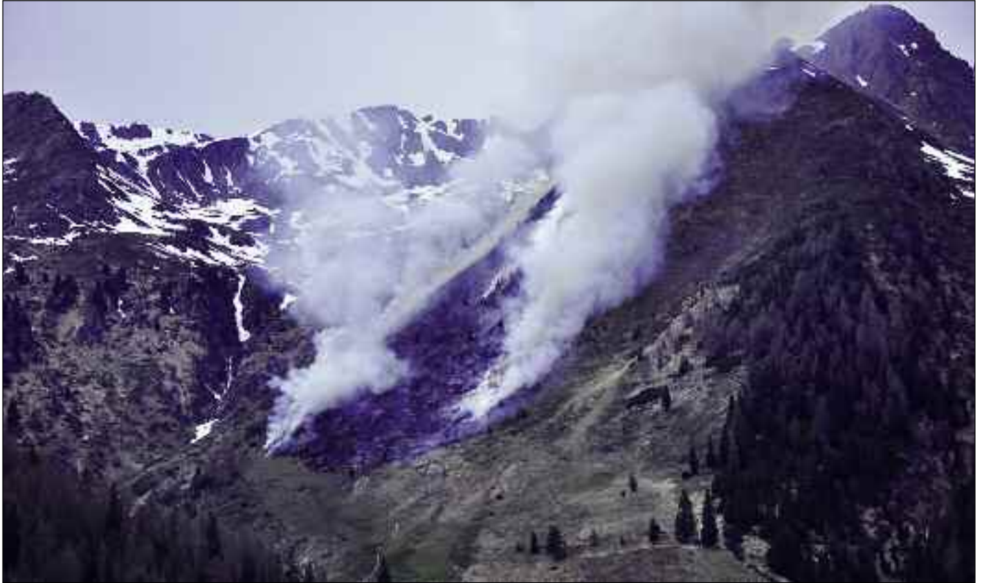
Wald- und Flächenbrand oberhalb der Unterstaller Alm