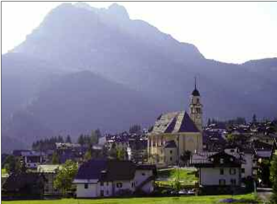
Sappada / Plodn