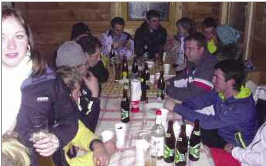
Mondscheintour zum Stall der Agrargemeinschaft