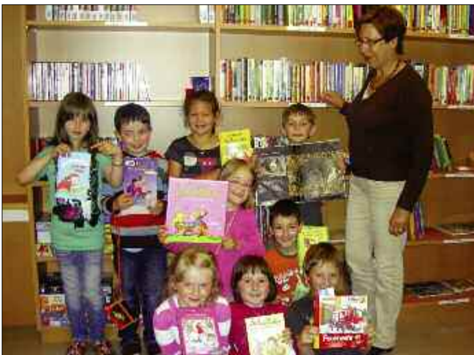
In der Bücherei finden wir immer tolle Kinderbücher