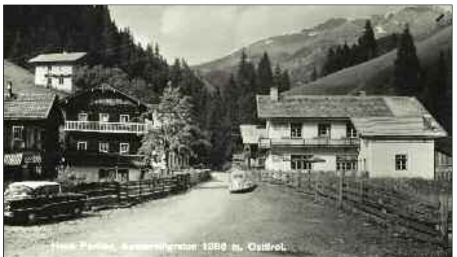
Bei der Aufnahme von 1955 sieht man neben dem Gasthof Perfler den eingezäunten "Hazer Garten", dem heutigen Dorfplatz. Gegenüber steht das Einfamilienwohnhaus mit dem Kellerfenster, wo schon zu Zeiten des Kraxenkrumer der Handel untergebracht war.