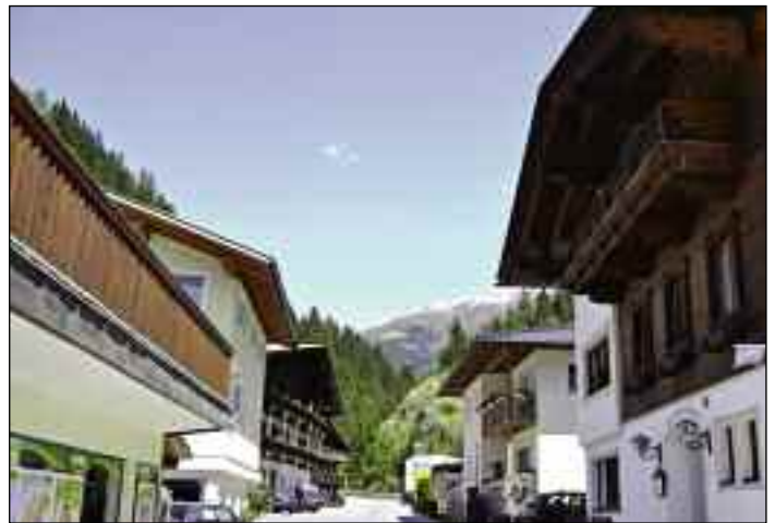
Kaufhaus und Gasthaus an der Winkeltalstraße