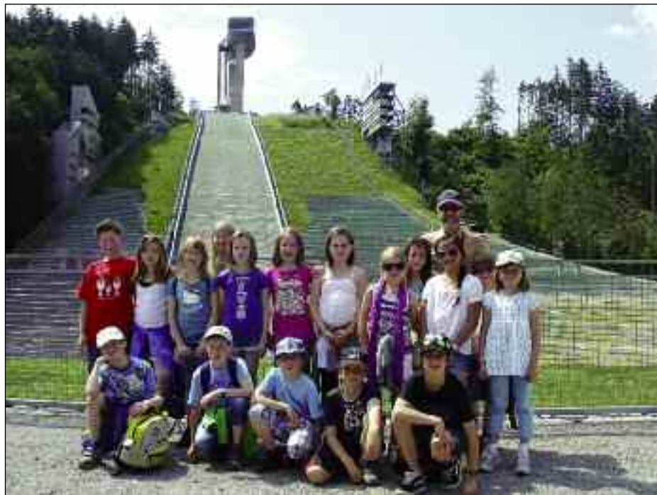
2. Klasse am Berg Isel

- Die SchülerInnen der 4. Schst. erhalten praktischen Fahrradunterricht in Sillian, mehrere Unterrichtseinheiten