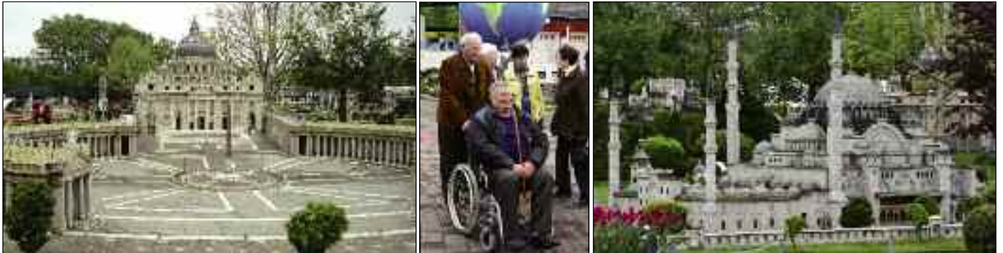
30. April: Ausflug mit dem Bus nach Klagenfurt, Besichtigung von Minimundus und Maria Wörth Vl.: Petersplatz und Petersdom (Rom), auch „Fußmarode“ werden betreut, Suleiman Moschee (Istanbul)