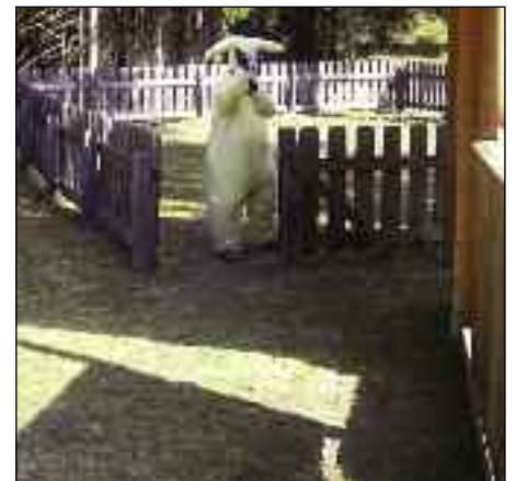
Riesenosterhase auf dem Spielplatz

Aussage einiger Kinder, als wir für die Osternestsuche auf den Spielplatz gingen und wir dort den echten Osterhasen trafen. Unvergesslich und fast nicht zu glauben war dieser Anblick. Natürlich wussten wir dann sofort, dass auch unsere Osternester nicht weit weg sein konnten, und wir machten uns natürlich sofort auf die Suche. Diese war dann auch erfolgreich.