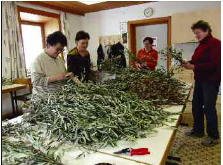
Ölzweige und Palmen werden gebunden