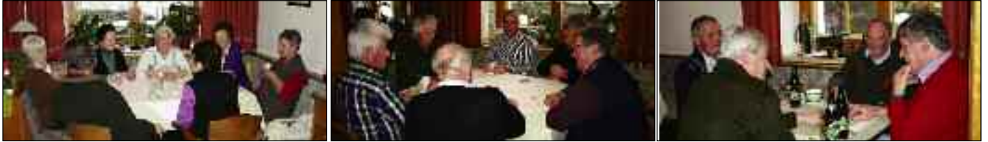
In den Wintermonaten trafen sich Freunde des Kartenspiels zu gemütlichem Beisammensein beim Watten oder Tarock im Niederbruggerhof