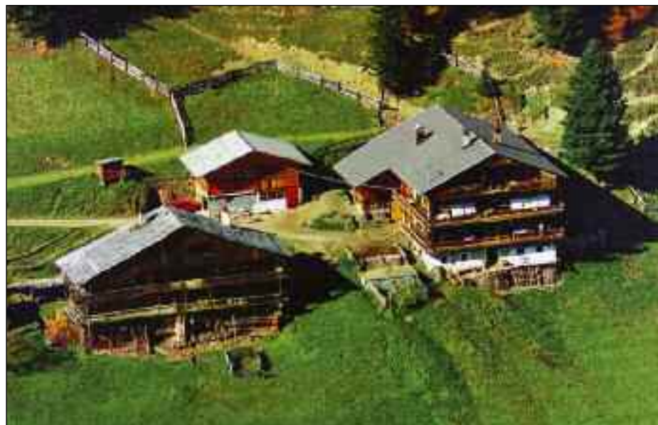
Das Farbfoto ist aus den 1980er Jahren und wurde von der Fam. Außerbrand zur Verfügung gestellt. Hier sieht man, dass nur mehr der Wohnteil steht, der Wirtschaftsteil ist schon abgerissen worden. Foto: privat