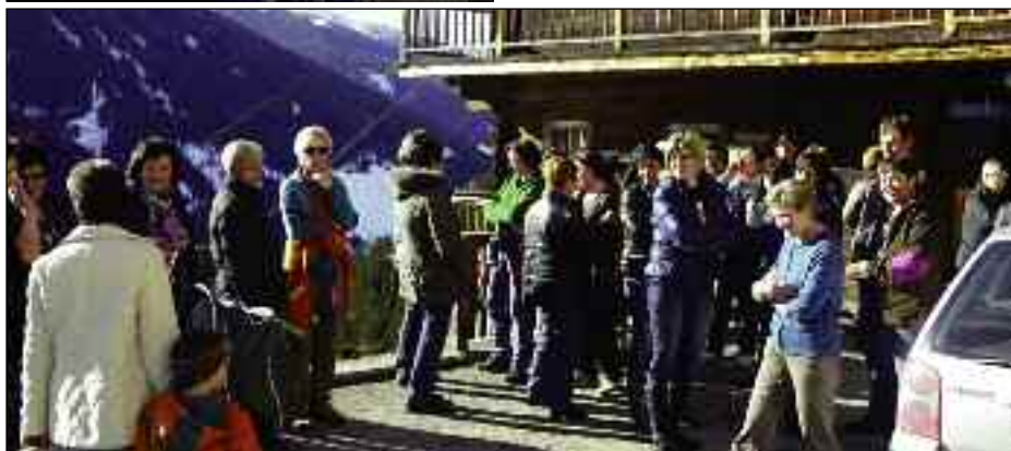
Teilnehmerinnen bei verschiedenen Aktivitäten

gen und mit „an Schnaps!“ begrüßt. Nôchan is in Kelldô gông. Do Durra Flôr in seinem Element. Flôr zeigte uns das Teppichwirken und erklärte