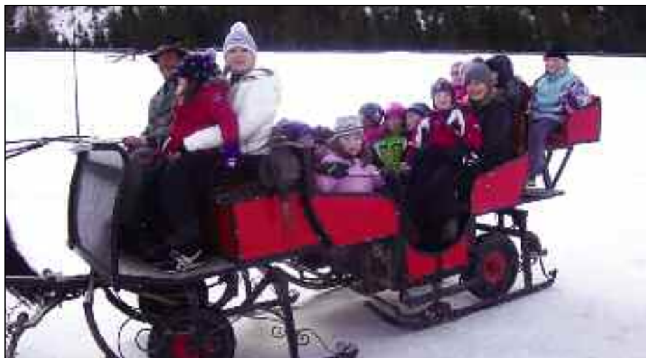
Eine lustige Pferdekutschenfahrt