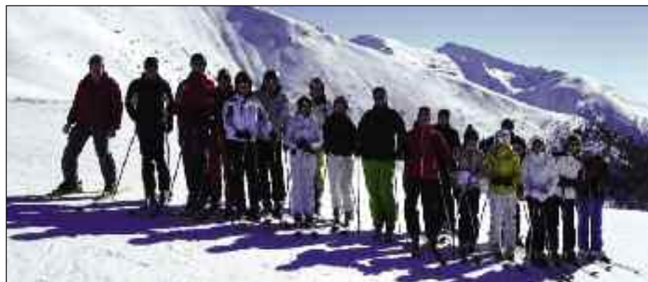
Mitglieder mit Partner beim Schitag am Helm