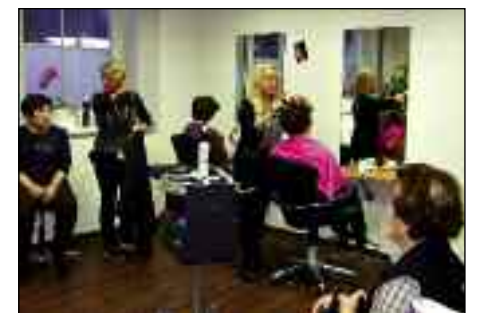
Dienstleistungen in der körperKULTUR werden von der Villgrater Bevölkerung genutzt

Alle bei der Gemeinde abgeschlossenen Mietverhältnisse (auch bestehende Mietverträge) sind an die geänderten Umsatzsteuer-Richtlinien anzupassen und zu vergebühren. Dies betrifft die Vermietung im Haus Valgrata und vom Musikpavillon. Künftig muss in die Miete eine Afa-Komponente eingerechnet werden. Die jährliche Afa-Komponente muss mindestens 1,5 Prozent der Anschaffungs- oder Herstellungskosten inklusive Grund und Boden betragen.