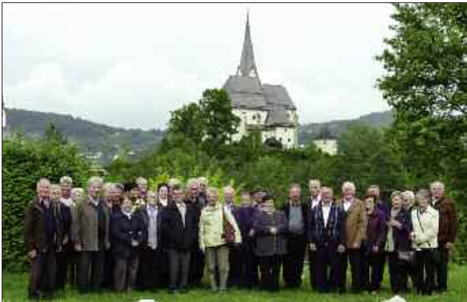
In Maria Wörth, wo wir zufälligerweise beim Kirchenbesuch in den Genuss eines Chorkonzertes mit fünf Kärntner Chören kamen