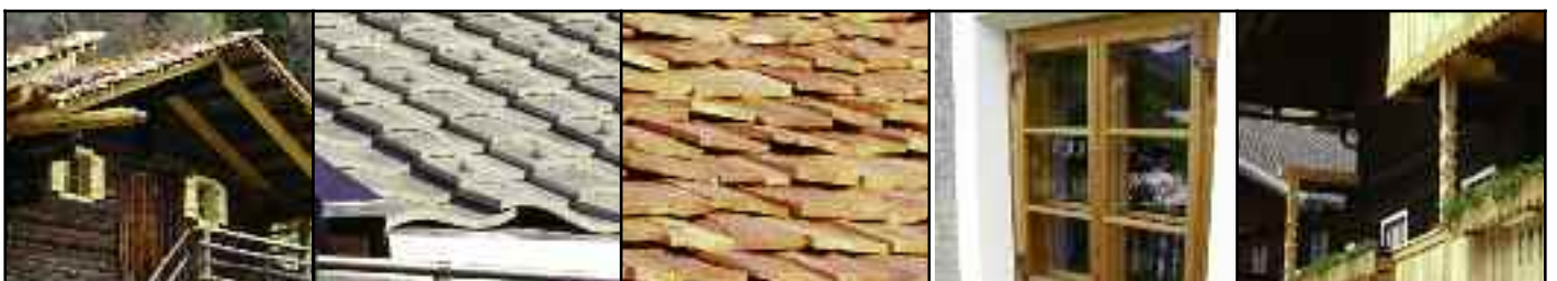
Beispiele: sanierte Gebäude (oben); Dach mit Schindeln oder S-Platten, Balkone, traditionelle Kastenfenster

tivität und Charakter. Immer öfter steht alte Bausubstanz leer und verfällt oder wird abgetragen, während am Ortsrand Neubauten entstehen. Auch gut gemeinte aber unsachgemäße Sanierung verursacht Schaden an diesen Gebäuden. Sensibler Umgang mit alter Bausubstanz schließt Wohnkomfort nicht aus.