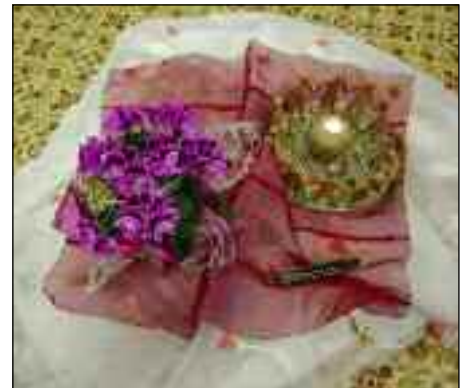
Gestaltete Mitte im Frauenraum

Wir fühlten uns beim Adventabend und bei Klängen aus uns selbst wunderbar geborgen.