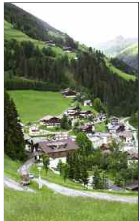
Die Aufnahme aus ca. 1927 zeigt die Veränderungen und Entwicklungen des Dorfes in 84 Jahren.