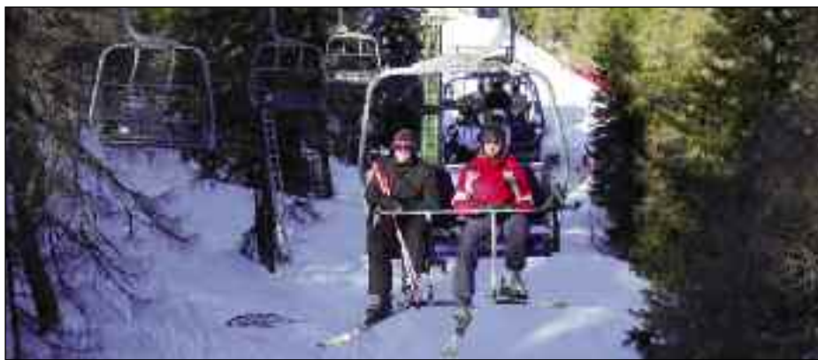
Bei so schönem Wetter ist das Liftfahren kein Übel