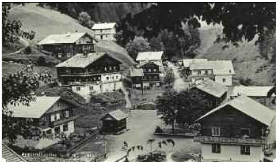
Aufnahme um ca. 1954