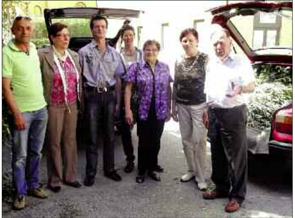
Beim Kloster „Sacerdoti del Sacro Cuore“