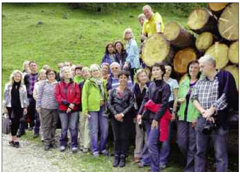
Teilnehmer der Bundestagung der Geografielehrer. Sie verbrachten am 31. Mai 2011 den Nachmittag im Villgratental.

guit gschaffn mitnander`. Der Vater stirbt, der ältere Bruder bekommt das große Hamatl. Dieser kann es selber nicht mit ansehen, dass der andere gar nichts haben soll, grad deswegen, weil er um ein Jahr später auf die Welt gekommen ist. Der Hof ist groß. `Teilen wir`, schlägt der junge Bauer seinem Bruder vor, `es bleibt für jeden von uns noch weitaus genui.` An einem schönen Tage im Langes (Frühling) haben sie `Marstefn (Grenzpfähle) eingeschlat`. Aber aus der Teilung ist nichts geworden... es ist von den Behörden verboten worden, dass jeder Bruder die Hälfte des väterlichen Erbteiles haben sollte.“ Die Gründe, welche die zuständige Behörde zur Ablehnung der Teilungen veranlassten, sind mir nicht bekannt geworden. Nach dem Höfegesetz wäre eine Teilung zulässig, wenn jedes der Teilstücke einer fünfköpfigen Familie den Unterhalt zu gewähren vermag. Gewiss, der Kampf gegen schrankenlose Zersplitterung der Bauerngüter ist notwendig. Das haben schon unsere Vorfahren erkannt und zweckmäßige Gesetze gegen Güterteilung eingeführt. Dadurch haben sie eine wichtige Grundlage für die Erhaltung eines kräftigen Bauernstandes geschaffen.