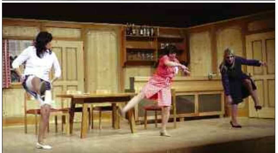
Szenen aus „Der kitzlige Punkt“