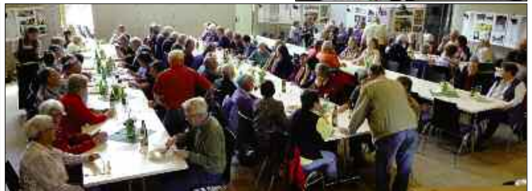
Am 27. Mai wurde der Bezirkswandertag der SeniorenInnen in Außervillgraten durchgeführt. Beim Unterwilder Rundgang wurde zu „Lusser“ nicht nur gelabt, sondern auch musiziert. Im Haus Valgrata war der offizielle und gemütliche Abschluss für 120 Teilnehmer.