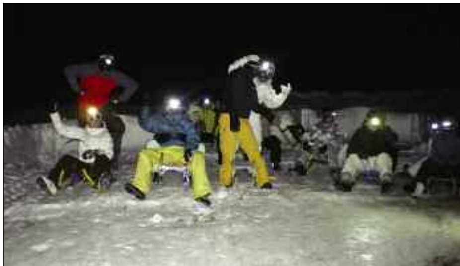
Viel Spaß hatten wir beim Rodelabend bei der Leckfeldhütte

Heuer trugen wir das traditionelle Fassdaubenrennen am 12. Februar 2011 wieder als Nachtrennen beim Neferhof aus. 64 Starter wagten sich heuer auf die Fassdauben und sodann auf die besonders eisige Bahn. Bei der Preisverteilung wurden die Sieger der Rennklasse Herren, Rennklasse Damen und Juxklasse gekürt. Die ersten 3 Plätze jeder Klasse erhielten eine Brettljause, für jeden weiteren Gewinner gab's tolle Sachpreise.