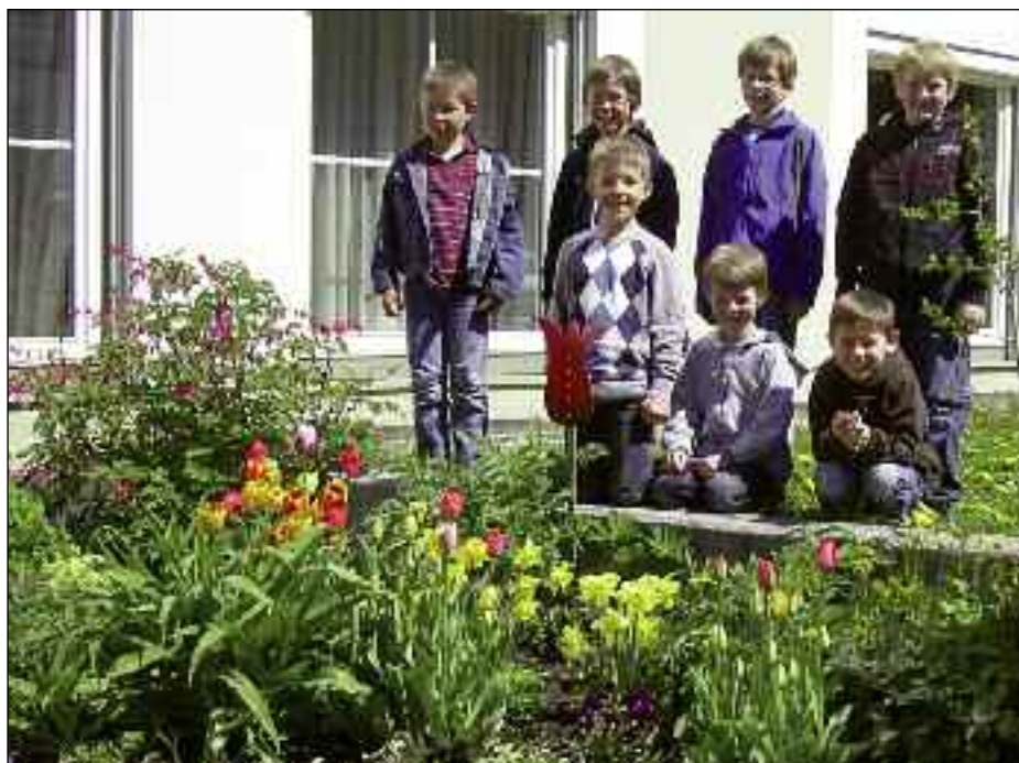
Die Betreuung des Schulgartens macht Freude

- Das Lernen hat nicht immer Spaß gemacht!