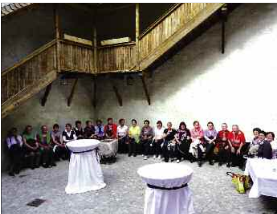
Innenhof in Schloss Lengberg