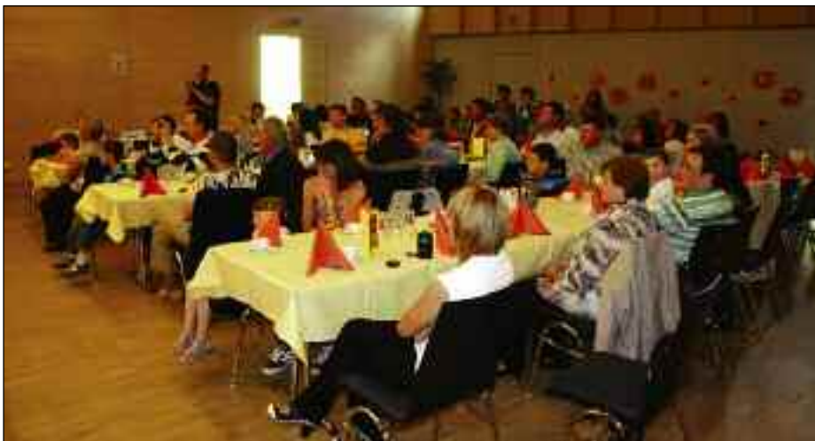
Familienfeier im Haus Valgrata für Eltern, Großeltern, Geschwister ...