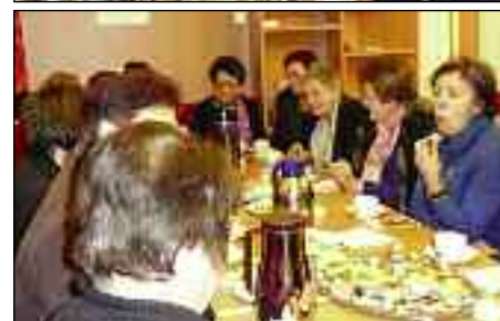
Rechts: Die Bücherei als Treffpunkt für die Frauenrunde