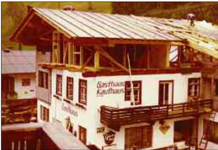
1979 erfolgte die Aufstockung