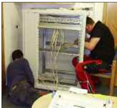
EDV-Anlage wird installiert

Für die geplante touristische und gastgewerbliche Erweiterung bei der Thurntaler Rast ist die Änderung des