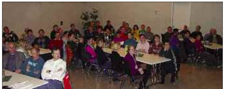
Öffentliche Gemeindeversammlung am 24. Jänner 2011

Der Gemeinderat beschließt die geänderten Satzungen (F § 7) des Gemeindeverbandes „Hauptschulverband Sil-