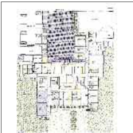
Planentwurf Grundriss Ebene 0

Die Hauptschule Sillian überzeugt auch nach ca. 40 Jahren immer noch in ihrer architektonisch-räumlichen und organisatorisch-funktionalen Gestaltung. Wir begegnen ihr daher mit dem größtmöglichen Respekt und behandeln sie „denkmalschützerisch“. Das bedeutet, die Schule so unverändert wie möglich zu belassen, sämtliche Defizite aber mit einem gezielten, konzentrierten und zurückhaltenden Eingriff zu beseitigen.