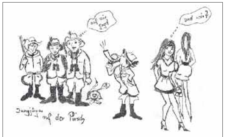
Das Dilemma der 4 Jungjäger: Wofür sollen wir uns entscheiden? Zeichnung: Maria Weitlaner

Dieser Tagesordnungspunkt wird aufgrund personenbezogener Daten unter Ausschluss der Öffentlichkeit behandelt und die Beschlüsse in einer eigenen Niederschrift festgehalten.