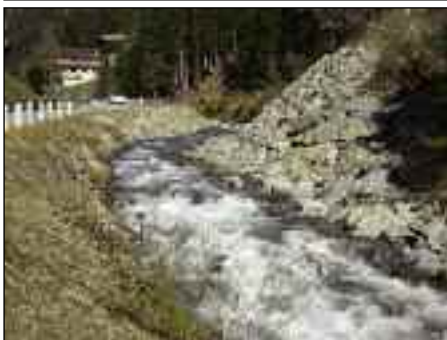
Sanierung Hangrutsch „Zulehen-Wald“

festgestellt. Eine geologische Begutachtung hat ergeben, dass die Hang-