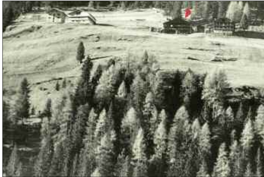
Rechts Häuser des Brandhofes am Versellerberg, beachtlich das Doppelhaus Außerbrand-Mitterbrand, links die Neubauten von Außerbrand (Bartler)