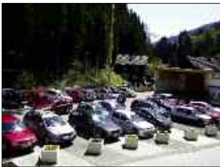
Es gibt Anlässe, da erscheint der Dorfplatz fast zu klein

Der Beschluss über die Änderung des Flächenwidmungsplanes im Bereich der Gp. 933/2, 2080/2, 2077/1 und 2077/2, KG Außervillgraten, entsprechend dem Planentwurf des staatl. bef. u. beeid. Ziviltechnikers Dr. Mag. Thomas Kranebitter, wird durch vier Wochen hindurch zur allgemeinen