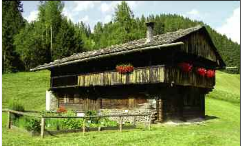
Puichar Freilichtmuseum der Bauernkultur

ist heutzutage die Haupteinnahmequelle und mit der Zeit hat die Zahl der Beherbergungsbetriebe und Lifte zugenommen. Politisch gehört Sappada / Plodn seit 1852 zur Provinz