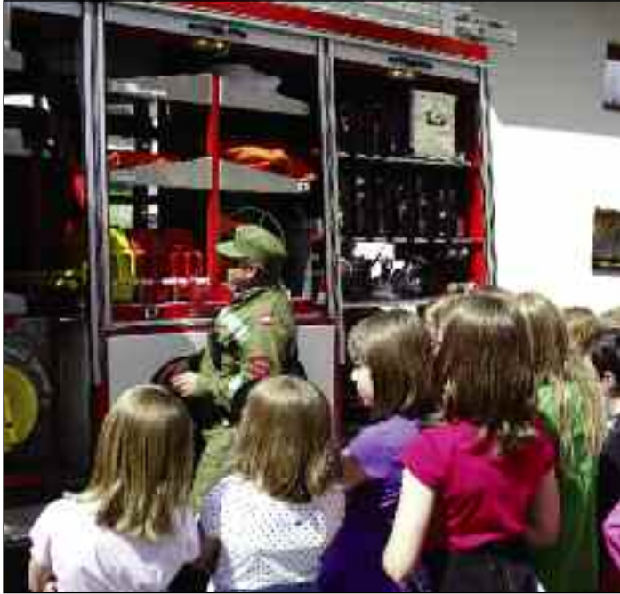
Nach der Alarmübung wird das Feuerwehrauto von innen gezeigt

- Wir hatten eine nette Klassengemeinschaft. Ich habe viele Freunde gewonnen.