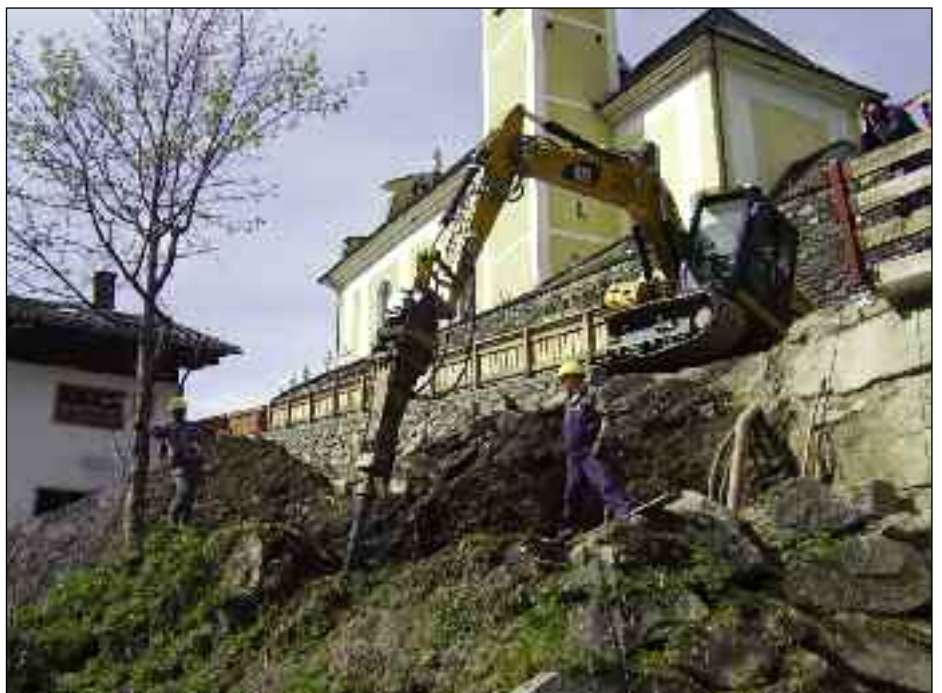
Sanierung am „Weibersteig“

Sollte bis eine Woche nach Ende der Kundmachung keine Stellungnahme von einer hierzu berechtigten Person oder Stelle einlangen, beschließt der Gemeinderat ebenfalls einstimmig die Erlassung der Änderung des Flächen-