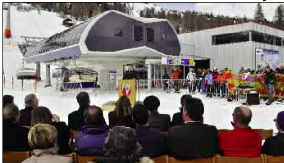
Segnung der neuen 6er-Sesselbahn am 31. März 2011

Der Gemeinderat erhebt einen Gesamtbetrag von € 9.692,89 zur teilweisen Deckung des Personalaufwandes für den Waldaufseher nach § 10 der Tiroler Waldordnung, LGBl. 55/2005 für das Jahr 2011. Diesem