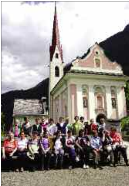
Vor der Wallfahrtskirche in Lavant

Noch ganz frisch in Erinnerung sind uns die Wallfahrt nach Lavant und der Besuch von Schloss Lengberg in