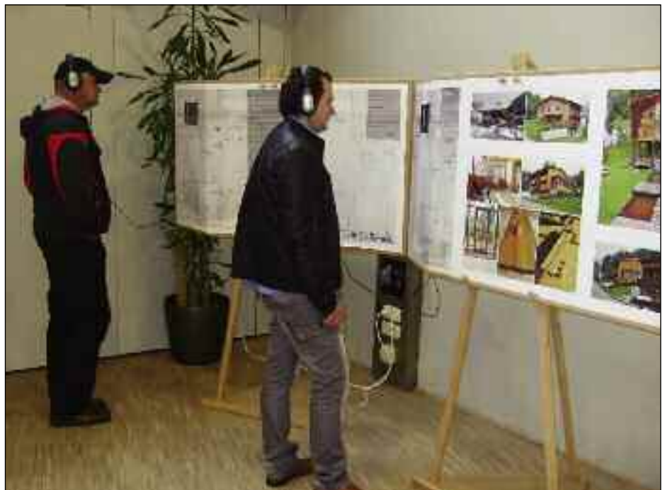
Die Wanderausstellung im Haus Valgrata vom 3.-13. Juni stand unter dem Motto "Bauen in Beziehung setzen". Auf den Schautafeln werden Beispiele gezeigt, wie das Bauen bzw. Sanieren im ländlichen Raum umgesetzt werden kann oder wie eine Neunutzung alter Bausubstanz aussehen könnte. Bei dieser Gelegenheit wurden auch die Wohnbauprojekte Alte Schule, Niederegger Feld und Walchboden präsentiert.