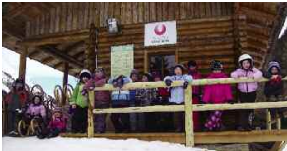
Bei der Rodl-Starthütte im Winkeltal