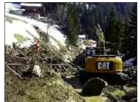
Villgratenbach - Bachsohle wird eingetieft

Im 2. Bauabschnitt werden die Hochwasserschutzmaßnahmen zwischen der neuen Sportplatz-Brücke und der Krumer-Brücke durchgeführt.