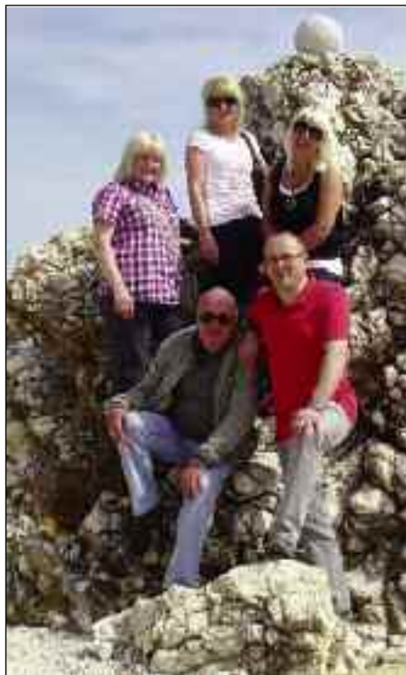
Singkreis Außervillgraten

Einige besondere Auftritte waren unter anderem das Kranzlsingen in Bruneck - Dietenheim (Höfemuseum), die Messgestaltung in der Klosterkirche der Herz-Jesu-Missionare in