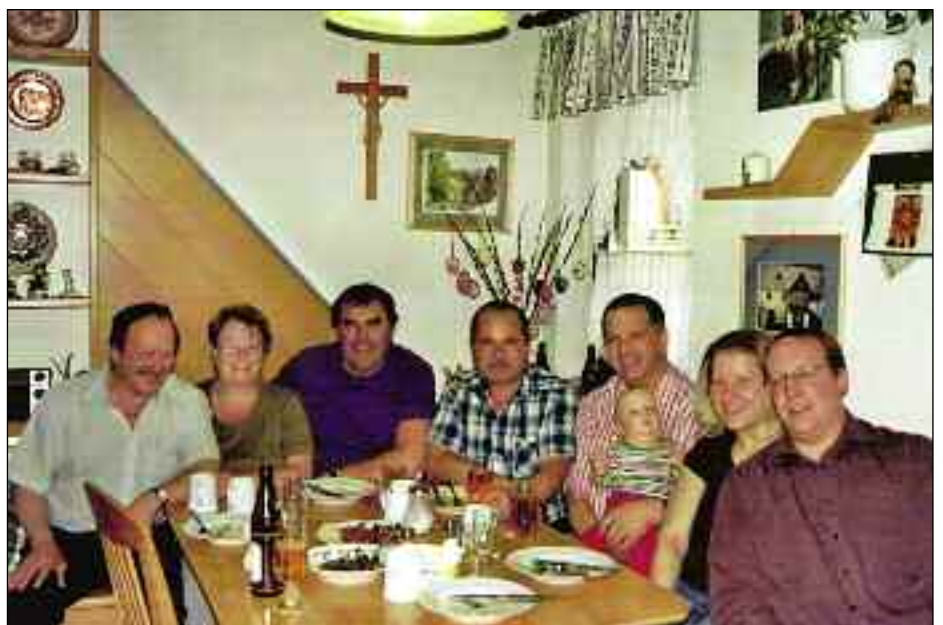
Zu Besuch bei der Theatergruppe Gloggnitz