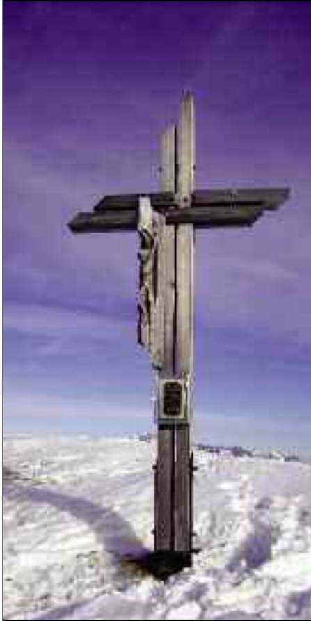
Anlässlich des 10-jährigen Jubiläums der Errichtung des Gipfelkreuzes auf dem Hochalmspitz findet dort am Sonntag, 21. August 2011, eine Bergmesse statt.