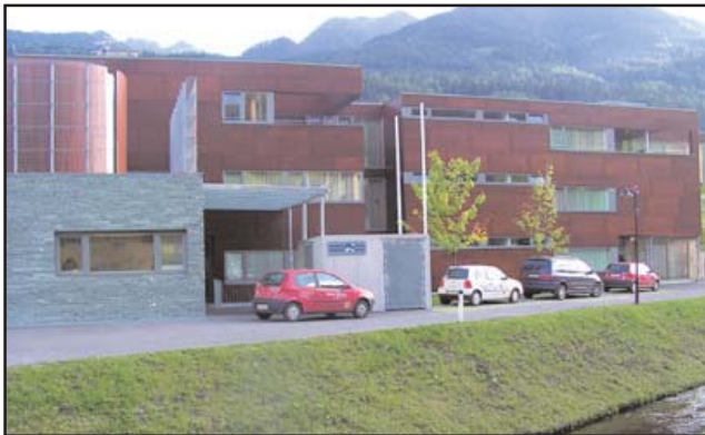
Hier ist auch der Gesundheits- und Sozialsprengel beheimatet

Wesentlich dafür sind Ausbildungstand und Kompetenzbereich, Zuständigkeiten, Zeiterfordernisse;