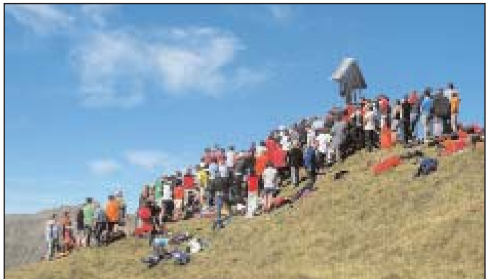
Bergmesse am 10. September 2006

Auf diesem Wege möchte sich die Gruppe der Beleuchtungsmacher Gölbner/Sommerwand bei Pfarrer Josef Mair für die feierliche Messgestal-