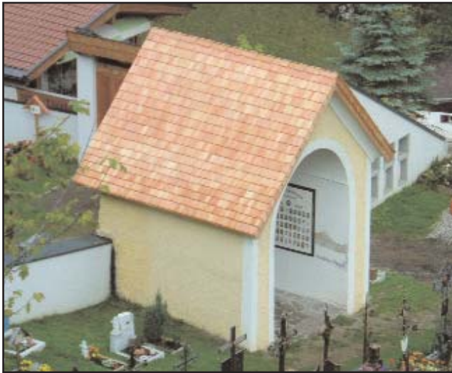
Die Friedhofskapelle wurde neu eingedeckt

Der Abstand zwischen den Grabstätten hat bei den Familiengräbern 0,40 m und bei den Einzelgräbern 0,20 m zu betragen.