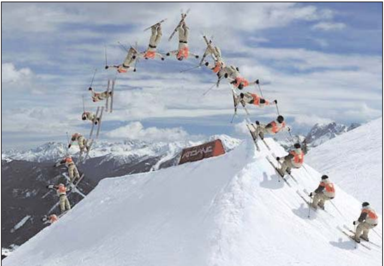
Schispaß am Thurntaler