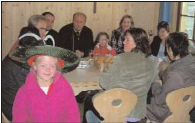
Bei der Bergwacht Villgraten in der Alten Schule

Anlass dafür war der neu gestaltete Jugendraum in der Alten Schule, den sich die Frauenrunde und die Bäuerinnenorganisation nun auch mit den Jugend-