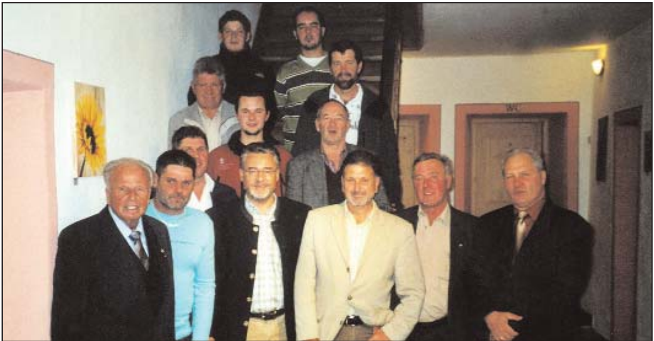
Der neu gewählte Vorstand der Union Raika Villgraten

Als nächster Tagesordnungspunkt stand die Neuwahl des Vereinsvorstandes auf dem Programm.