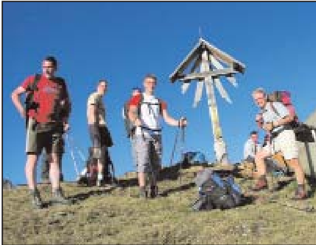
Ein Teil der Gölbner-Beleuchtungsmacher beim Köpfl-Kreuz

Werfen wir doch einmal einen kurzen Blick zurück auf die 200-Jahr-Feier vom Herz-Jesu-Gelöbnis im Jahr 1996: Dieses religiöse Fest war damals ein willkommener Anlass für die Beleuchtungsmacher Gölbner/Sommerwand, ein Holzkreuz auf dem