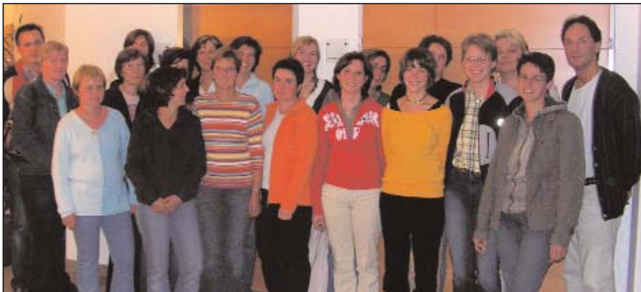
Das Team des Gesundheits- und Sozialsprengels Osttiroler Oberland

und die notwendige erforderliche Anteilnahme und Hilfe zukommen zu lassen.