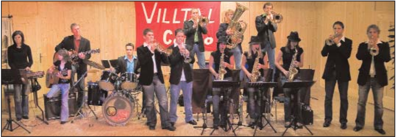
Die Villtal-Combo bei ihrem ersten Auftritt im Haus Valgrata

Musikrichtung bei den ehemaligen Asslinger Musikanten, dem Dolomitensextett sowie bei verschiedenen anderen Kapellen gesammelt. Er selbst komponiert und arrangiert im hauseigenen Studio in Außervillgraten. Das Repertoire der „Villtal-Combo“ reicht vom James Last Sound bis zu aktuellen Hits, Oldies und Ever-greens im Big-Band Sound, also einer Musik für Früh- und