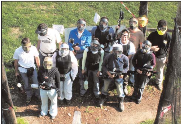
Die Mutigen treten zum Paintballspiel an

Da wir im letzten Winter unseren alljährlichen Schitag ausfallen ließen, entschieden wir uns stattdessen als krönenden Abschluss der heurigen „tanzintensiven“ Sommersaison für einen gemeinsamen Ausflug nach Krems in Niederösterreich. Abfahrt war am Samstag um 5 Uhr morgens. Ein