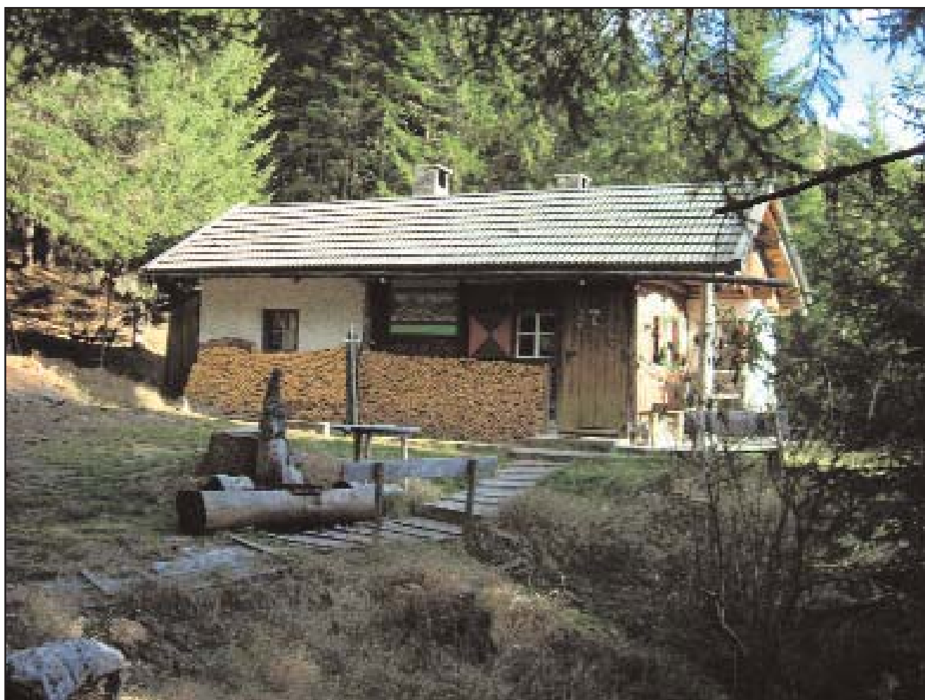
Hubertushütte im Spätherbst