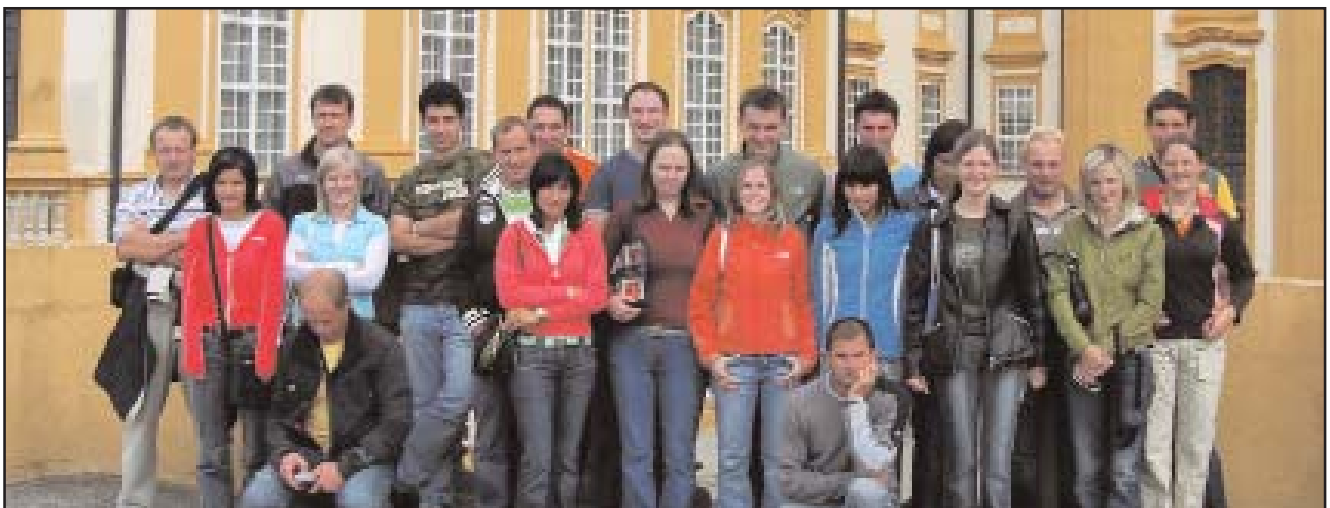
Die Teilnehmer vor dem Stift Melk

Am nächsten Morgen erschienen dann wieder alle frisch und munter beim Frühstück. Der gemeinsame Wahlgang zur Nationalratswahl gestaltete sich anfangs etwas schwierig, da nicht alle Wahlbüros unsere Wahlkarten annehmen wollten. Schlussendlich klappte aber dann doch noch alles und wir konnten zu unserem nächsten Programmpunkt weiterfahren, zum Stift Melk. Die geführte Besichtigung durch das riesige Gebäude war richtig interessant und hat bei uns allen großen Eindruck hinterlassen. Wir aßen dort auch gleich noch zu Mittag und traten erst am Nachmittag den Weg nach Hause an. In Lienz machten wir noch einmal einen letzten Stopp und da sich bei einigen der Hunger wieder bemerkbar machte, gingen wir noch gemeinsam Pizza essen. Um ca. halb zehn Uhr abends kamen wir dann heil in Außervillgraten an, und damit gingen zwei schöne, unvergessliche Tage in netter Runde zu Ende.