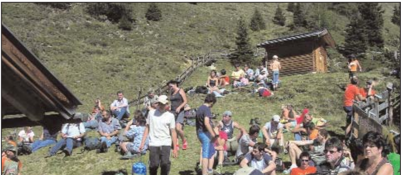
Bei traumhaftem Wetter wird bei der Sommerwandhütte gerastet und gefeiert

und die Bergwelt ist nicht nur schön, sondern birgt leider auch viele Gefahren. Deshalb braucht es auch weiterhin verlässliche Leute, auf die man zählen kann und die dieses zu einem nicht mehr wegzudenkenden Brauchtum gewordene „Beleuchtung machen“ weiterführen. Interessierte sind jederzeit herzlich willkommen mitzugehen!