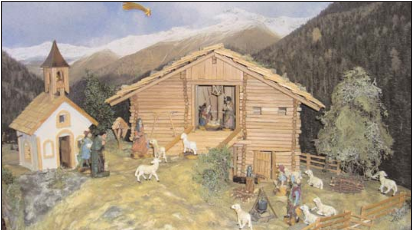
Krippe von Jakob Weitlaner nach einer alten Aufnahme des Mooshofes im Winkeltal

Noch am selben Nachmittag lockte das „Villgrater Adventsingen“ über 300 Besucher an, um den