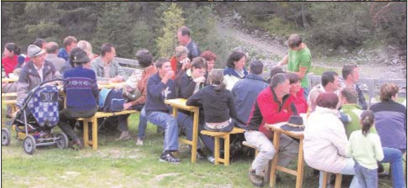
Almfest bei der „Leiter Kaser“ mit Hupfburg, Bierkistensteigen und gemütlichem Beisammensein