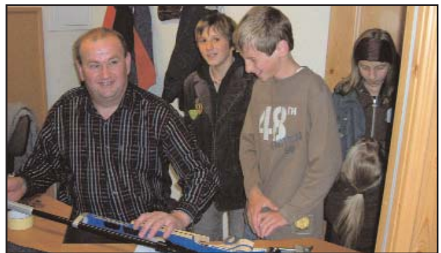
Bei den Schützen in der Alten Schule

Um die Besucher zum Bleiben zu bewegen, wurden belegte Brötchen vorbereitet und Getränke gegen freiwillige Spenden ausgegeben. Eine ausgelassen gute Stimmung fand man vor allem im Raum des Männerchores und des Singkreises vor, wo es – wie sollte es auch anders sein – musika-