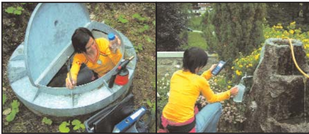
Jährlich wird an Quellen und Entnahmestellen die Wasserqualität geprüft

c) Aufgabe der Lawinenkommission ist es, auf Verlangen der Hochpustertaler Bergbahnen Nfg. GmbH & CoKG die Lawinensituation im Schigebiet Sillian zu beurteilen.