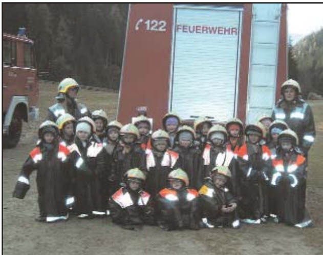
Feuerwehrynachwuchs in Warteposition

Mit heller Begeisterung nahmen die Kindergartenkinder an ihrem „Feuerwehrtag“ teil. Viel Neues und Interessantes konnten sie von fachkundigen