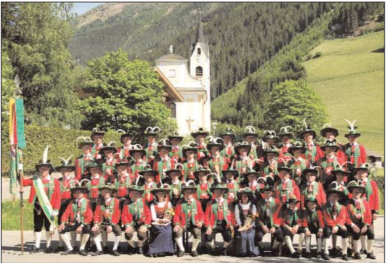
Schützenkompanie Außervillgraten am Fronleichnamstag 2006

Beim Totengedenken gedachte die Versammlung der im abgelaufenen Vereinsjahr verstorbenen