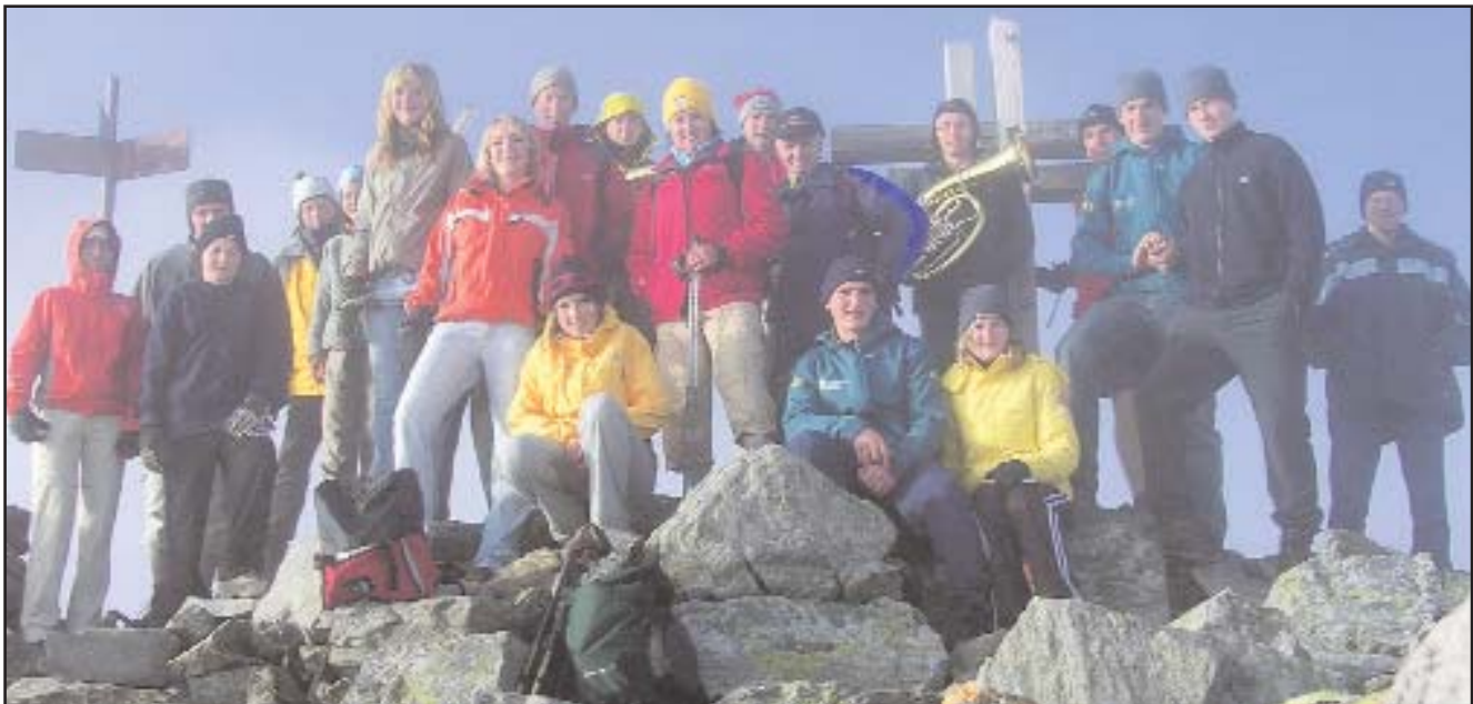
Aufstieg zum Regenstein und beim Gipfelkreuz

Um 13:00 Uhr konnte das Almfest bei der „Leiter Kaser“ im Winkeltal beginnen. Schon am Tag zuvor trafen die Burschen von der Landjugend intensive Vorbereitungen zu diesem Fest. Die größte Herausforderung bestand darin, ein „gerades Stück Villgraten“ zu bauen, denn die aufblasbare Hupfburg brauchte einen ebenso waagrechten Boden wie der Untergrund fürs Bierkistensteigen.