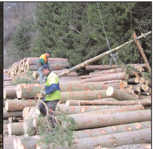
Holzlieferung über Winkeltalbach und Winkeltalstraße