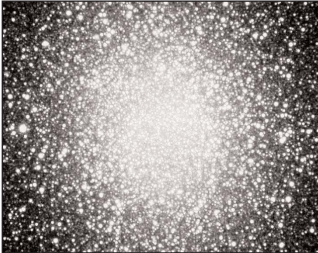
Omega-Centauri, ein Kugelsternhaufen aus mehreren Millionen Sternen. Diese Sternenzusammenballung umkreist mit etwa 150 anderen Kugelsternhaufen unsere Milchstraße.