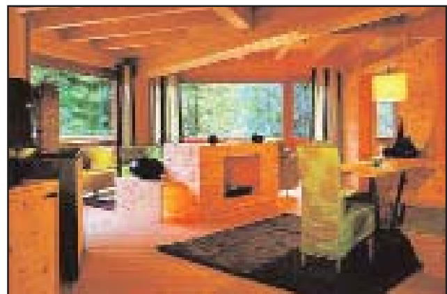
Naturhotel Waldklausen im Ötztal