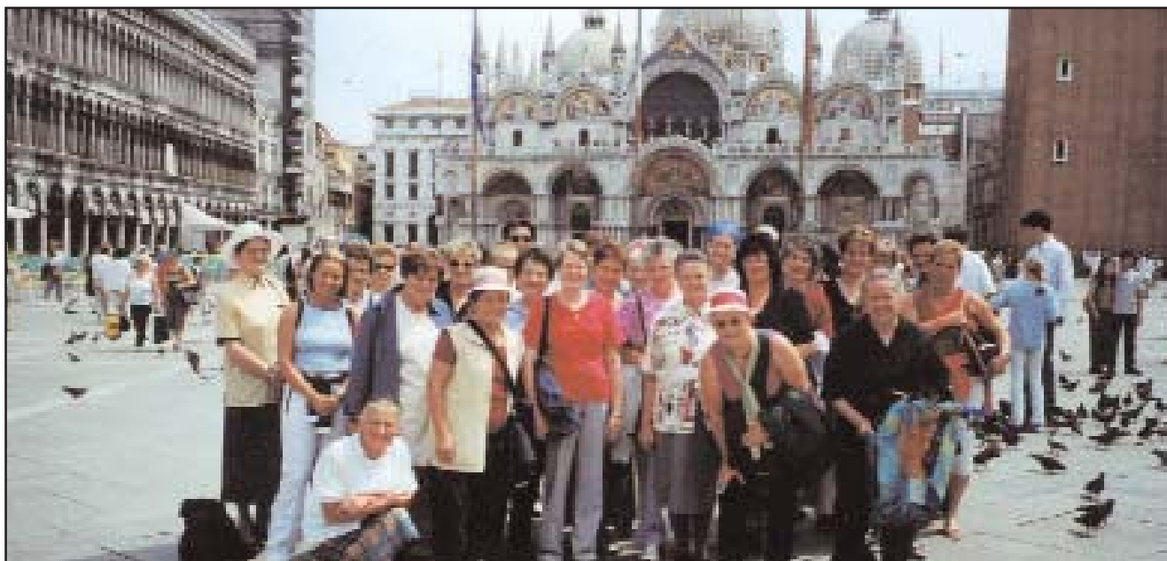
Ausflüge, Reisen, Feste, Aktionen, Gespräche, ... ein vielfältiges Programm