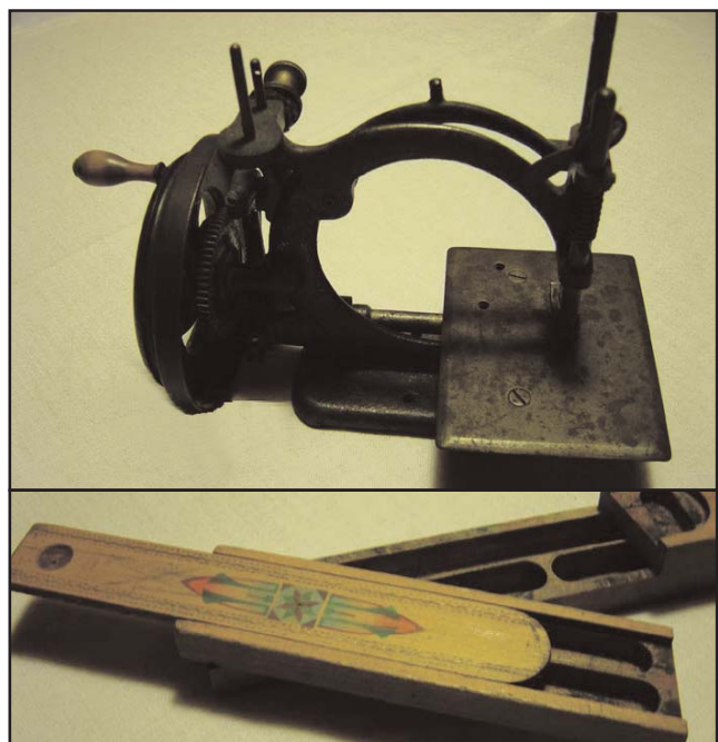
Stör Nähmaschine und Griffelschachten

Ein kleines Team wird sich mit diesem Thema beschäftigen. Für Hinweise und gute Tipps sind wir dankbar, bitte im Gemeindeamt melden!