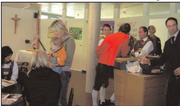
Jugendzimmer der JB/Landjugend im Haus Valgrata

lichen aus dem Dorf teilen wird. Ebenso das vor kurzem fertig eingerichtete Jugendzimmer der Jungbauernschaft/Landjugend und Volkstanzgruppe Außervillgraten im Haus Valgrata, das bei der Eröffnung des Mehrzweckgebäudes vor zwei Jahren noch kalt und leer wirkte, war mit seinem neuen Küchen- und Ausschankbereich, der gemüt-