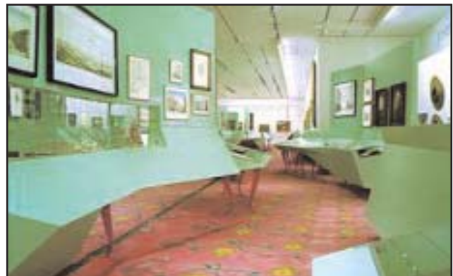
Mozartausstellung in der Wiener Albertina