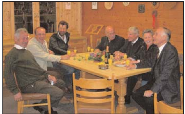
Beim MGV und Chorraum in der Alten Schule

Sei es mit Hilfe von selber gebastelten Plakaten, aufgelegten Fotoalben zum Schwelgen in Erinnerungen, Protokollbüchern, stimmungsvollen Powerpoint-Präsentationen oder aufgestellten Gegenständen – jeder Verein hat sich bestens präsentiert und das Vereinsleben, die Aufgaben und die bisher durchgeführten Tätigkeiten für jeden an-