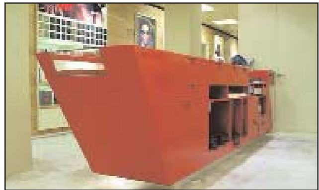
Bekleidungsgeschäft „Don Gil“ in Innsbruck

Das Ahornblatt wünscht der Franz Walder GmbH weiter hin alles Gute!