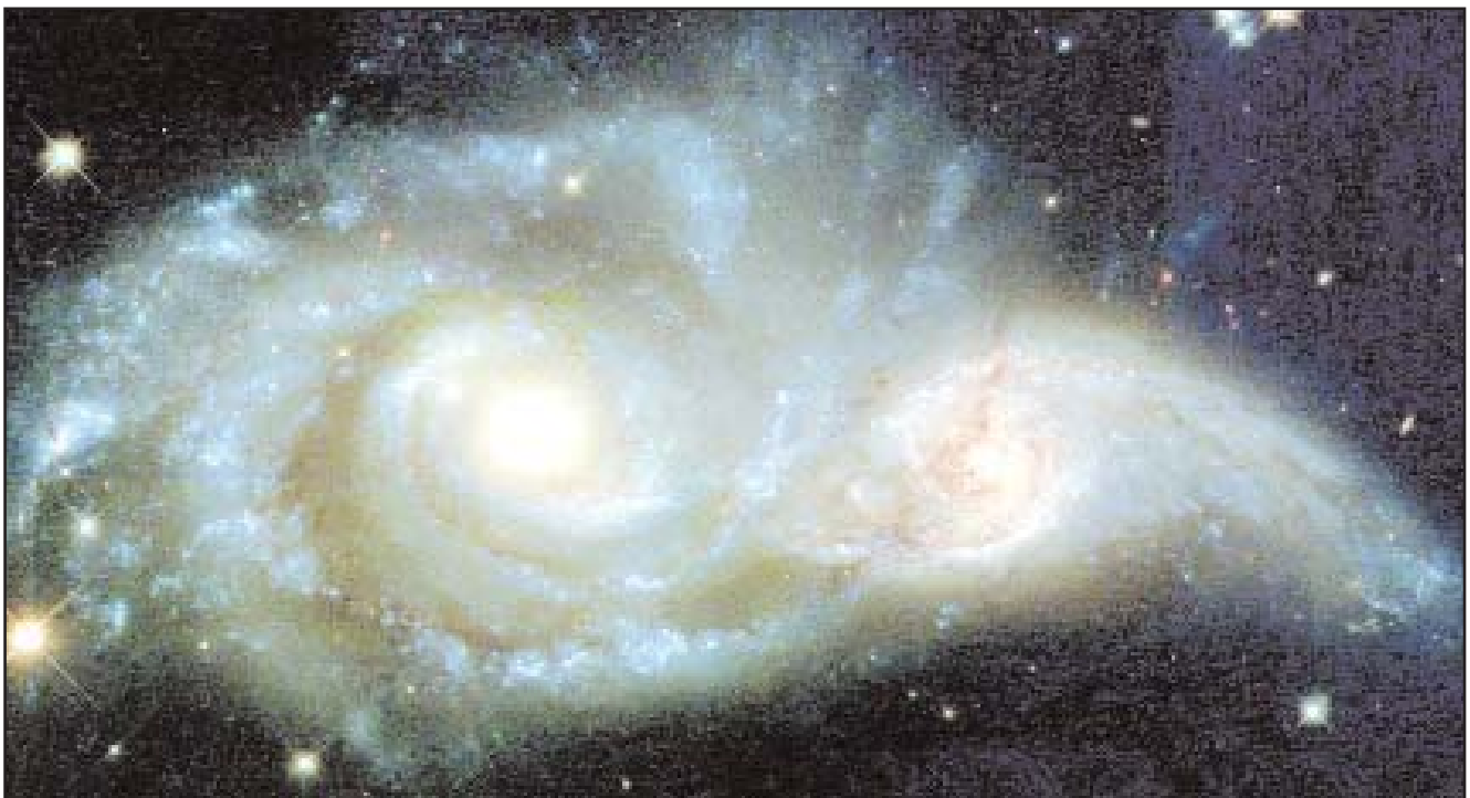
Das Bild zeigt zwei kollidierende Galaxien.

Sterne sind nicht Götter, sie sind nicht Engel, sondern Geschöpfe Gottes, aber Zeichen der Ankunft seiner allmächtigen Liebe in Christus und unserer Ankunft im ewigen Leben bei Gott. Sterne sind Zeichen eines doppelten Advent, Gottes Advent bei uns: er ist der Schöpfer; und unser Advent bei Gott: er ist der Erlöser.