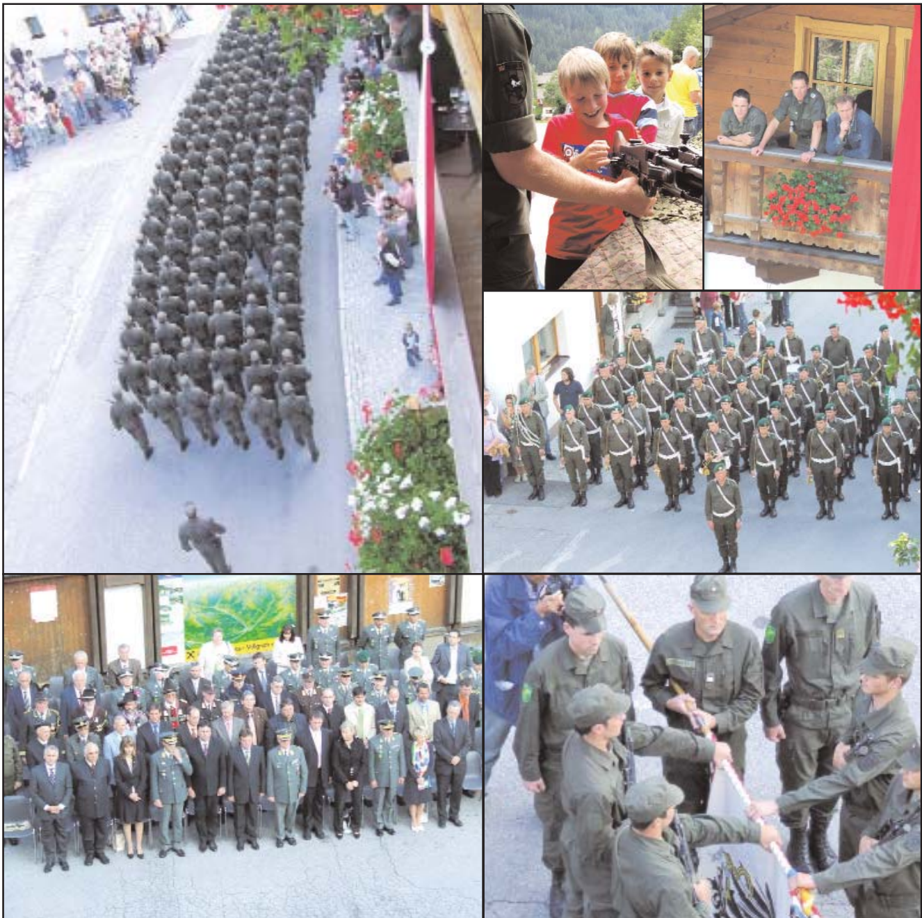
Bilder von der Angelobung mit Ehrengästen, Soldaten, Musikkapelle, Schützen, ...