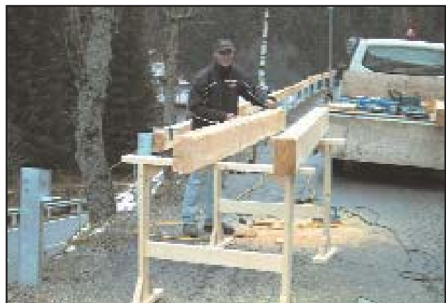
Die Leitschienen an der „Stina Zäune“ werden erneuert

Für zusätzlich benötigte Müllsäcke wird die volle Gebühr verrechnet. Nicht verbrauchte Säcke können auf das Folgejahr nicht angerechnet werden.