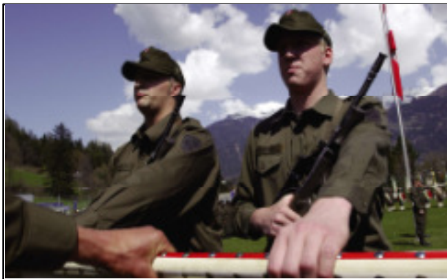
Angelobungsformel gemäß § 41 Abs. 7 Wehrgesetz 2001

"Ich gelobe, mein Vaterland, die Republik Österreich, und sein Volk zu schützen und mit der Waffe zu verteidigen; ich gelobe, den Gesetzen und den gesetzmäßigen Behörden Treue und Gehorsam zu leisten, alle Befehle meiner Vorgesetzten pünktlich und genau zu befolgen und mit allen meinen Kräften der Republik Österreich und dem österreichischen Volke zu dienen."