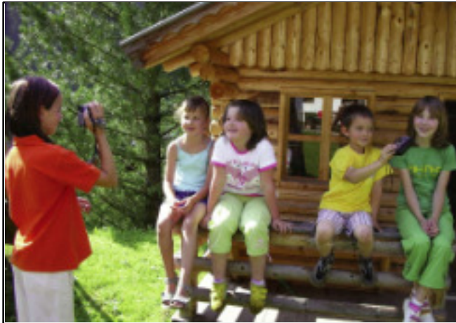
Kinder filmen, fotografieren, interviewen

Kinder- und Jugendmitbestimmung, also junge Menschen in ihrem Denken, Fühlen und Handeln ernst zu nehmen, ist nicht nur eine menschenrechtliche Frage (UN- Kinderrechtskonvention), sondern vor allem eine Frage der Menschenwürde. Ob