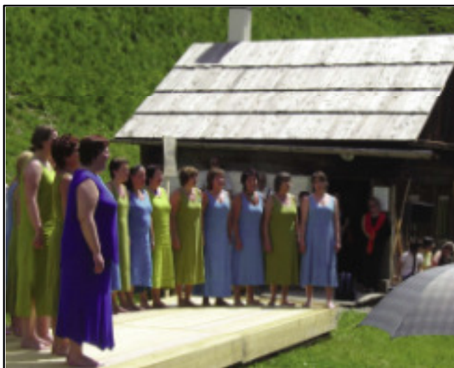
Frauenchor aus Skandinavien