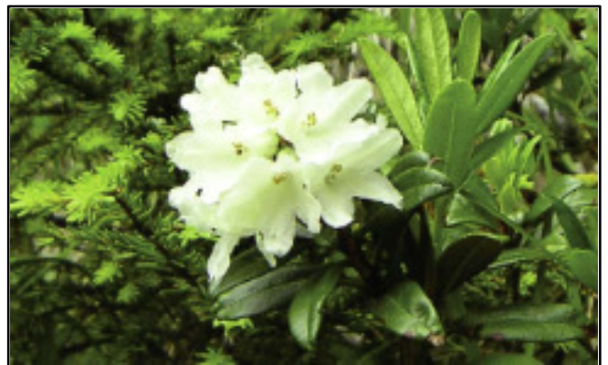
Alpenrose (Rhododendron ferrugineum) in Weiß als Laune der Natur