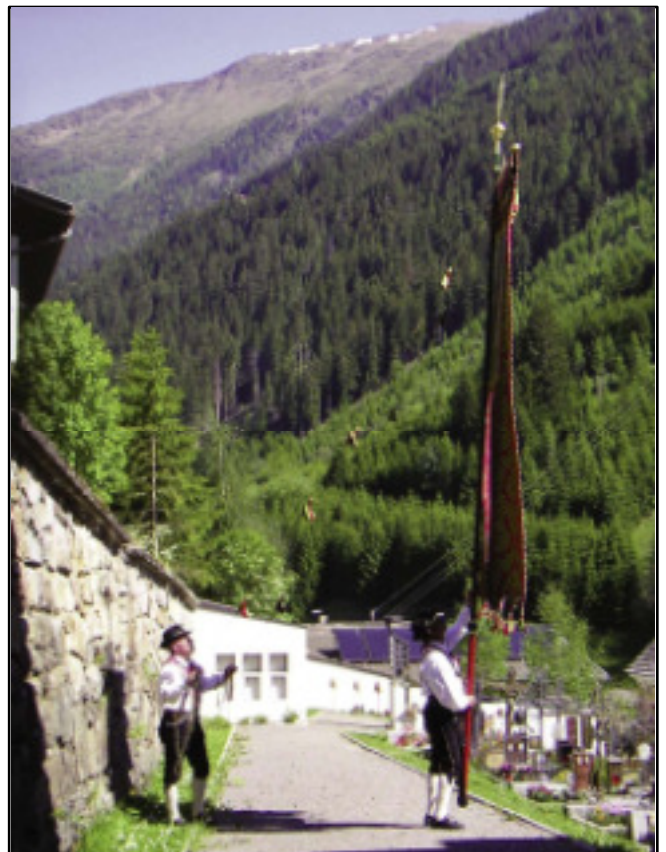
Die Standesfahne der Männer nach der notwendigen Restaurierung

Unser nächster Beitrag ist die Mitgestaltung der Eröffnung und Segnung des Kinderspielplatzes am Sonntag, 9. Juli 2006.