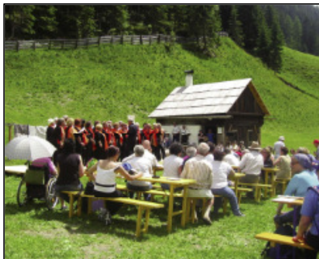
Kammerchor aus Norditalien