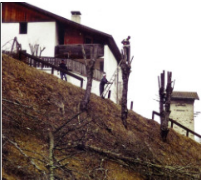
Mit Zustimmung des Eigentümers Bergmann Konrad vlg. Hatzler wurden am Osterdienstag Laubbäume an der "Stiener Zeine" gestutzt.