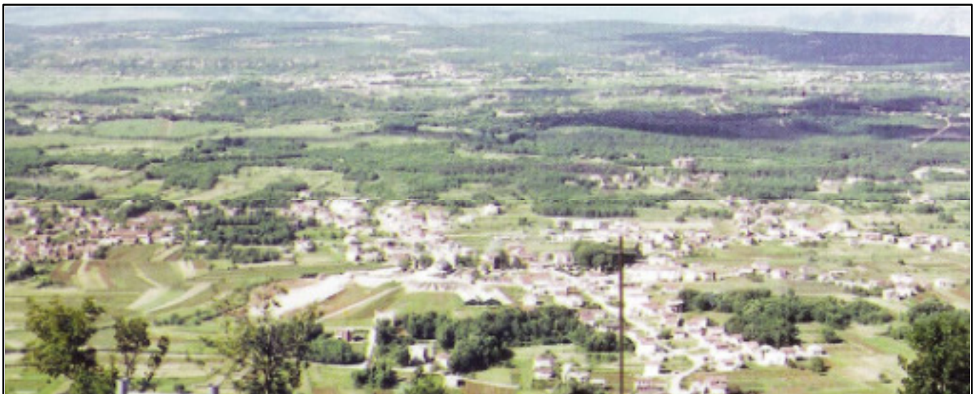
In Medjugorje gibt es seit Juni 1981 Marienerscheinungen und ist seither Ziel vieler Pilger

Nach kurzem Besuch in der Kirche hieß es Abschied nehmen von Pater Pio, denn ein großer Reisetag stand bevor. Die Fahrt ging von San Giovanni nach Monte San Angelo - auf dem Gargano.