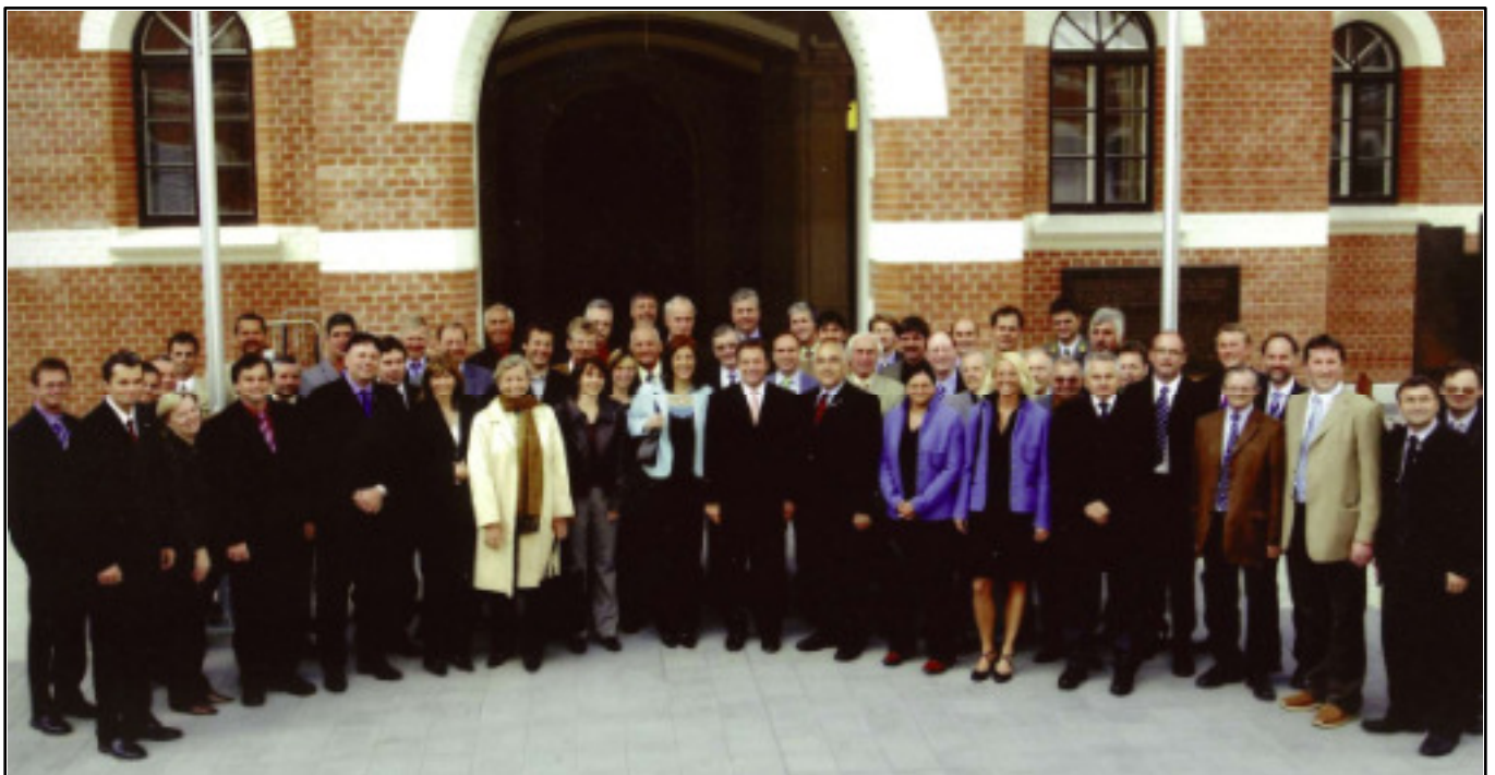
Wien-Besuch der Osttiroler Bürgermeister, Behördenleiter und Vertreter/innen von anderen Einrichtungen am 1. und 2. Juni 2006

Bin nun mal total verzaubert, von all den Bergen, wie dem Tal. Vom kleinen Dorf am Gabesitten: „Griaß enk“, bis zum nächsten Mal!