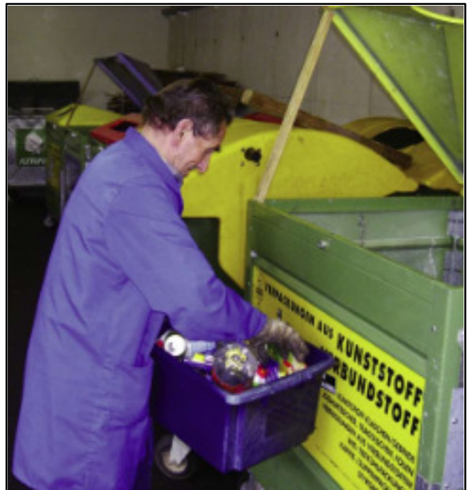
Ein letzter prüfender Blick