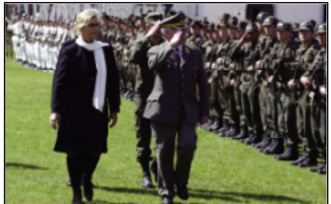
Angelobung der Rekruten des Einrückungstermines III/06

Die Gemeinde Außervillgraten demonstriert mit ihrer Einladung und Unterstützung "gelebte Partnerschaft" sowie Verbundenheit mit dem österreichischen Bundesheer und insbesondere mit dem Jägerbataillon 24; bereits im Herbst 1989 fand eine Angelobung in Außervillgraten statt.