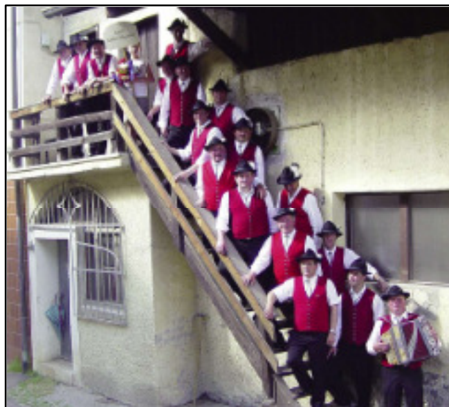
MGV beim Sängerfest in Dölsach